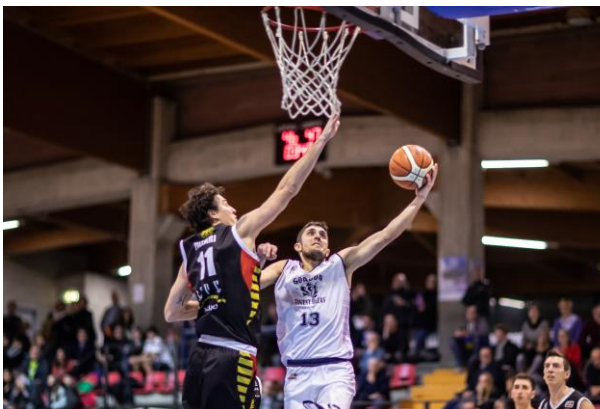
Foto Morale & PhotoLR: Capitan Marino' trascina NPO davanti ad un grande pubblico